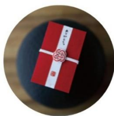
ぼちぶくろ 税込275円