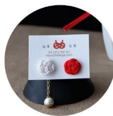
赤白ピアス 税込2,750円