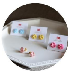
ピアス (うめ) 各種 税込2,420円