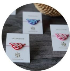
ピンバッチ (あわじ) 税込1,100円