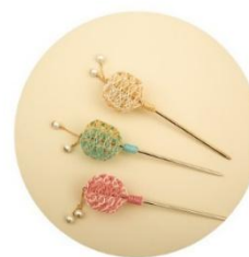
かんざし 各種 税込2,750円