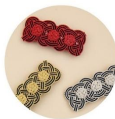
バレッタ 各種 税込1,980円