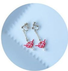
イヤリング (あわじ) 税込1,980円